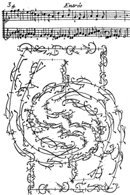
12.1 B - Raoul Feuillet